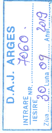
LISTA FUNCTIILOR PERSONALULUI DIN CADRUL DAJ. ARGES LA DATA DE 30.09.2019 conform art.33 din Legea - cadru nr. 153/2017